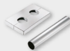
Rozeta 50 mm