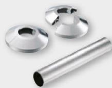
Rozeta na rozteč radiátora

K ventilom CUBE sú rozety súčasťou balenia designovej sady, okrem CUBE-COM.