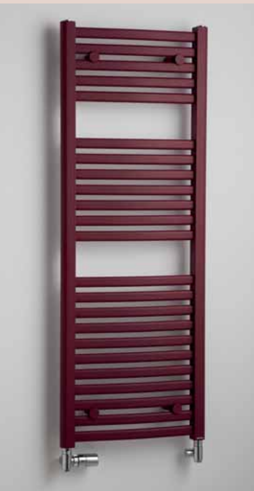
MARABU – vyhotovenie červená – štruktúrovaná farba 450 × 1815 mm

*Ostatné povrchové úpravy (lak) viď vzorkovník str. 65. **Pri vyhotovení chróm je tepelný výkon až o 20% nižší. ***Prepočet teplotných spádov na www.pmh-co.sk