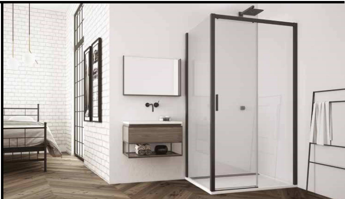
JEDNODIELNE POSUVNÉ DVERE S PEVNOU STENOU V ROVINE + BOČNÁ STENA TLS2 + TOPF2

JEDNODIELNE POSUVNÉ DVERE S PEVNOU STENOU V ROVINE