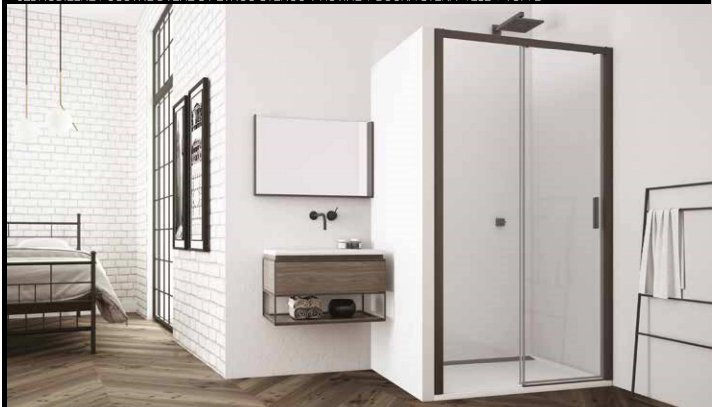
JEDNODIELNE POSUVNÉ DVERE S PEVNOU STENOU V ROVINE TLS2