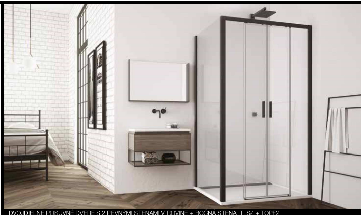
DVOJDIELNE POSUVNÉ DVERE S 2 PEVNÝMI STENAMI V ROVINE + BOČNÁ STENA TLS4 + TOPF2

DVOJDIELNE POSUVNÉ DVERE S PEVNÝMI STENAMI V ROVINE