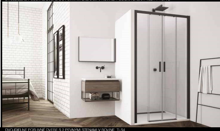
DVOJDIELNE POSUVNÉ DVERE S 2 PEVNÝMI STENAMI V ROVINE TLS4